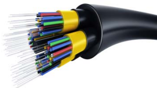
Талшықты-оптикалық сымдар – 5,5%