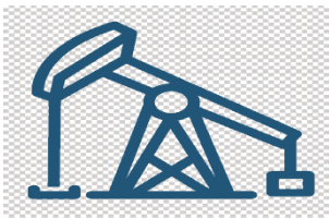
Шикі мұнай өндіру – 56,9%