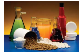
Басқа негізгі органикалық химиялық заттарды өндіру – 22,9%