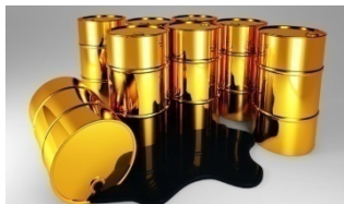
Мұнай өңдеу өнімдерін өндіру – 51,1%