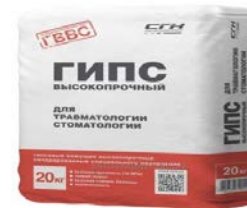
Құрылыс мақсаттарына арналған гипс өнімдерін өндіру – 12,4%