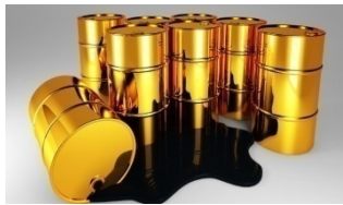
Мұнай өңдеу өнімдерін өндіру – 51,4%