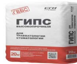
Құрылыс мақсаттарына арналған гипс өнімдерін өндіру – 12,4%