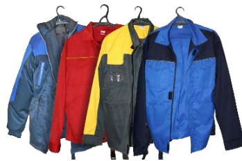
Арнайы киімдер өндіру – 5,9%