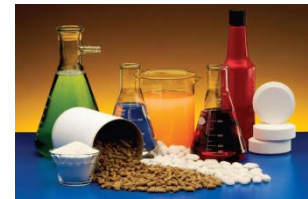
Басқа негізгі органикалық химиялық заттарды өндіру – 23,1%